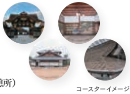
コースターイメージ

日時 10月25日(金)～12月8日(日) 8時45分～16時30分(最終受付:15時30分) 場所 二条城各所(受付:総合案内所、ゴール:大休憩所)