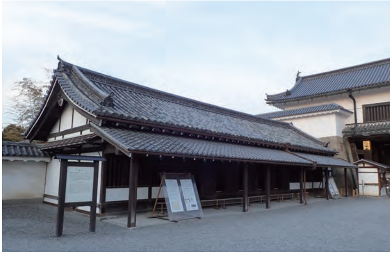
口絵4 元離宮二条城東大手門番所