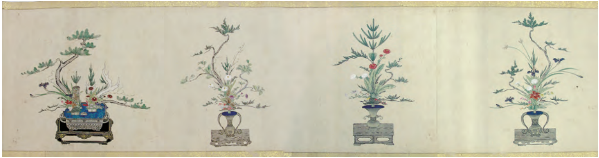
口絵 1 華道家元池坊総務所蔵「関東台覧立花砂之物図」(全体)