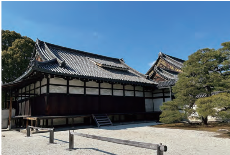
口絵5 元離宮二条城御清所