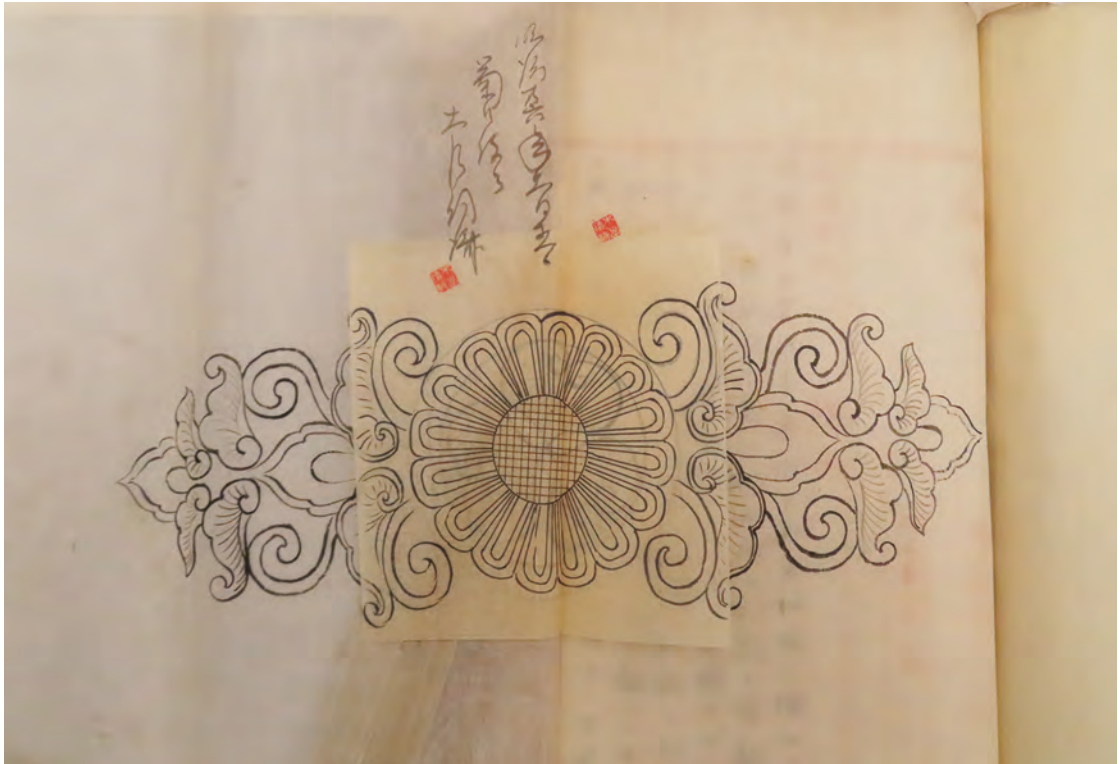
口絵7 宮内庁書陵部図書課宮内公文書館蔵「工事録 明治26年」(識別番号:4524)