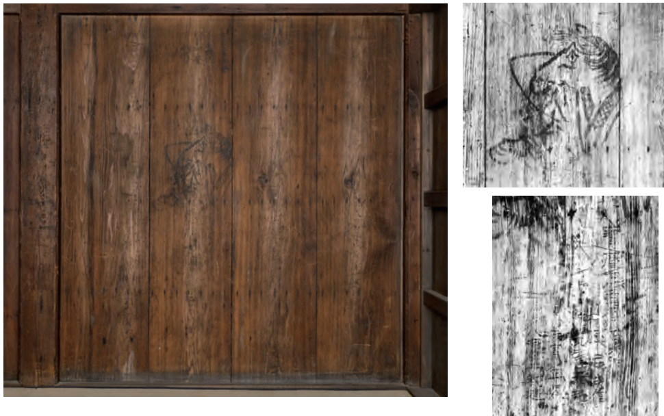
口絵6 御清所室内板戸の落書き（右は赤外線撮影による拡大写真）

中央に肩衣を着けた馬が描かれている。その下には「宝曆七 (丁) 丑四月七日大泊納 平岩親信・長尾景親・雨宮正央・八重盛教道」と掘られている。