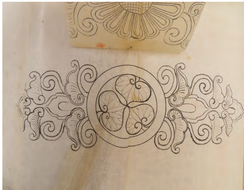
口絵8 同上 (めくった状態)