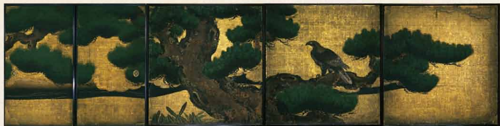
「松鷹図」大広間 四の間

そのため、修理に当たっては、「世界遺産・二条城一口城主募金」を募っております。皆様のご協力とご支援、よろしくお願い申し上げます。