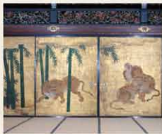
遠侍 三の間 竹林群虎図

遠侍は来殿者が控える場所で、二の丸御殿最大の建物です。来殿者が最初に立ち入るこれらの部屋は、襖や壁の絵から「虎の間」とも呼ばれています。尊猛な虎の絵や壮大な空間は徳川家の権力の大きさを実感させたとされます。