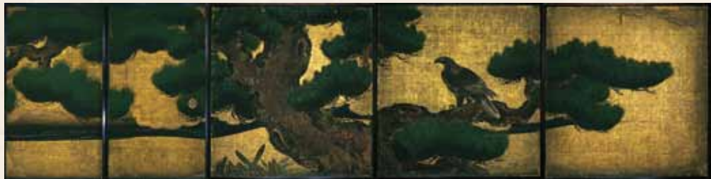
“松鷹图”大广间 四之间

因此，在修缮之际，开展了“世界遗产·二条城一口城主募捐”活动。敬请大家温情支援。