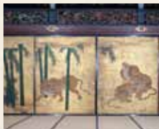
远待 三之间 竹林群虎图

远待是来殿者的等候场所，是二之丸御殿最大的建筑物。来殿者首先进入的这些房间，由于隔扇及墙壁上的绘画而被称为“虎之间”。凶猛的老虎图及宏伟的空间令人感到德川家权力之大。