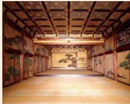
表明了大政奉还的大广间 从二之间看一之间

大广间是二之丸御殿的主室，是将军接见大名及朝臣们的房间。大广间的主要房间有“一之间”与“二之间”。一之间的地板比二之间高。接见时，将军在一之间朝南而坐。一之间有被认为曾经挂了三幅挂轴的壁龛，其旁边有摆放工艺品的错位板架。对面的右侧有称为帐台构的装饰门，装点着红色的流苏。左侧是付书院(像凸窗那样挑出廊子的书桌)。障壁画是狩野探幽的作品。