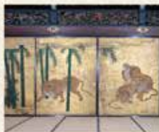
遠待 三の間 竹林群虎図

遠待は来取者が控える場所で、二の丸御殿最大の建物です。来取者が最初に立ち入るこれらの部屋は、襖や壁の絵から「虎の間」とも呼ばれています。勢猛な虎の絵や壮大な空間は徳川家の権力の大きさを実感させたとされます。